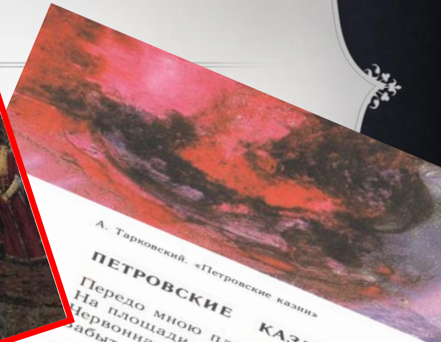
А. Тарковский. «Петровские казни»